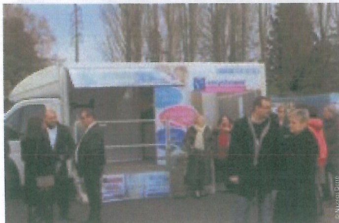
Le nouveau camion de présentation de la gamme Easyshower se déplace sur les salons.